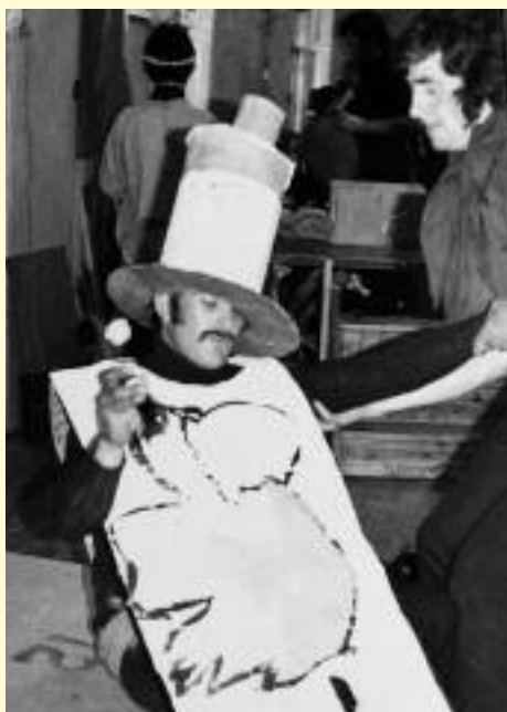
Frank sa dráma An Dreoilín a léirigh Aisteoirí na Tíre i 1975. Sé “An Rialtas” an teideal a bhí ar an gcarachtar a bhí aige sa dráma sin.